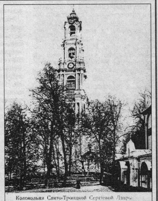
Колокольня Свято-Троицкой Сергиевой Лавры.

25 декабря 1919 г. (80 лет назад). С осени 1919 г. для Гефсиманского скита наступили по-настоящему тяжелые времена. В ноябре скит принял братию, изгнанную из закрытой Троице-Сергиевой лавры. Чтобы предотвратить закрытие скита, его преобразовали в Гефсиманскую трудовую сельскохозяйственную артель. Имущество артели, как «народное достояние», перешло в собственность государства и было передано артели «в бесплатное и бессрочное пользование» по соглашению, заключенному