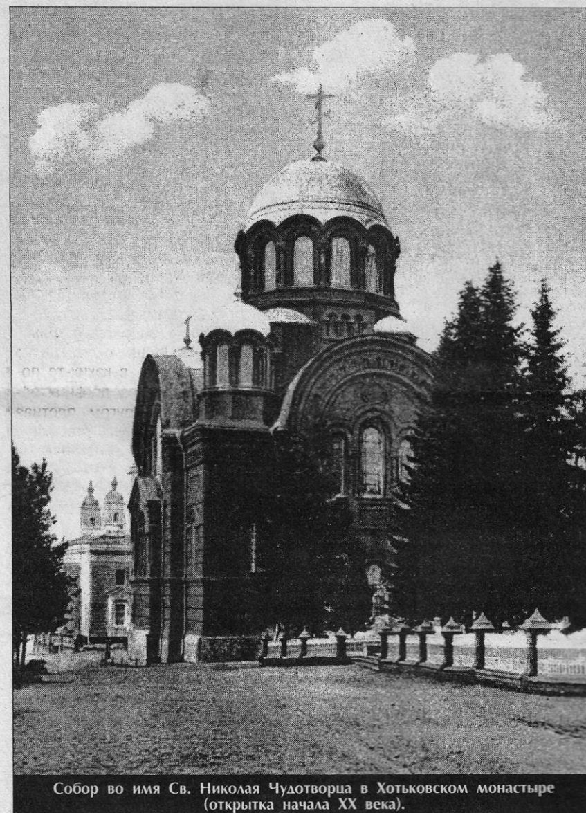
Собор во имя Св. Николая Чудотворца в Хотьковском монастыре (открытка начала XX века).

Скудные доходы от земледелия издавна вынуждали жителей окрестностей Хотькова заниматься промыслами, в том числе рубкой и возкой дров, шитьем мехов из мелких лоскутов. Дрова, меховую одежду, прочие изделия они сбывали на рынке у южных ворот монастыря. Здесь же продавали свои рукоделья хотьковские монахи и послушницы. Разгар торговли наступал на Покров Пресвятой Богородицы 1(14) октября. В этот день и всю последующую неделю внутри и вне монастыря шумела Покровская ярмарка, бойко торговали крестьянскими и монашескими рукодельями, калачами, пряниками, яблоками, орехами и прочим «съестным харчем».