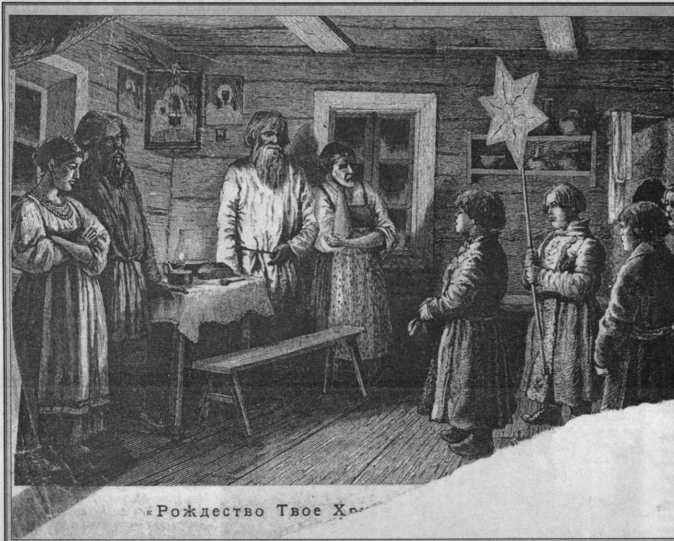
«Рождество Твое Христос»

Приложение к газете «Вперед», № 6 (54), ноябрь-декабрь 1999 года